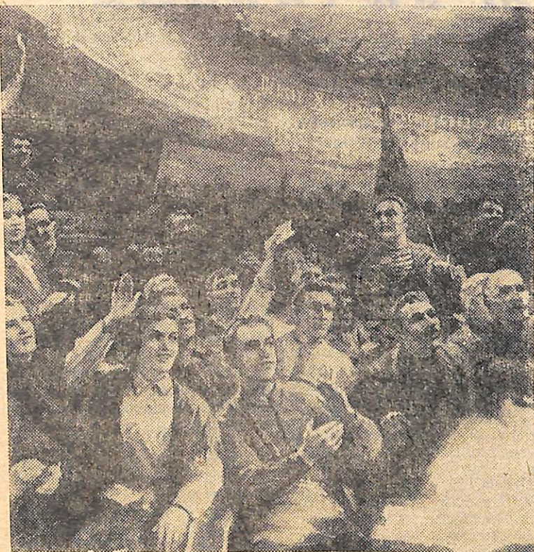
На десятом Всероссийском съезде Советов (1922 год) была принята резолюция об образовании СССР. (Картина художника Ю. Е. Виноградова. Из экспозиции Центрального музея Революции СССР).

Начался I Всесоюзный съезд Советов в первом часу дня. Присутствовало на нем 2.214 делегатов.