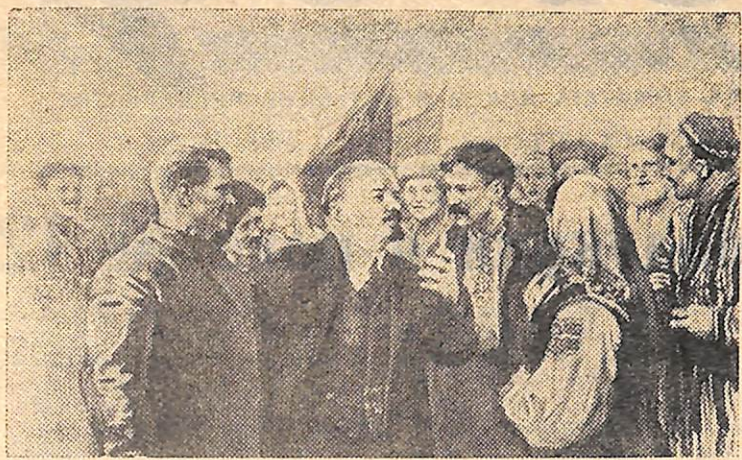
«В. И. Ленин — вдохновитель дружбы народов». Рис. художника Р. Розниченко.

Многие миллионы людей прошли через этот зал Центрального музея В. И. Ленина в Москве. И редкий посетитель не задерживался перед красными полотнищами Государственного флага СССР и государственных флагов первых четырех союзных республик — России, Украины, Белоруссии и Закавказской Федерации. На их фоне — большая контурная карта Советского Союза и строки, написанные характерным ленинским почерком: