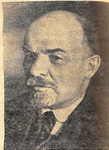
В. И. Ленин. Москва, 4 октября 1922 года.

Родины. Наша родная земля, Отчизна наша — это необъятные просторы, раскинувшиеся